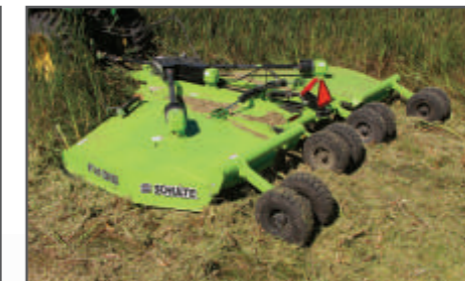
FX - 318 zdvojené nože s protiostrím při mulčování vysokého porostu