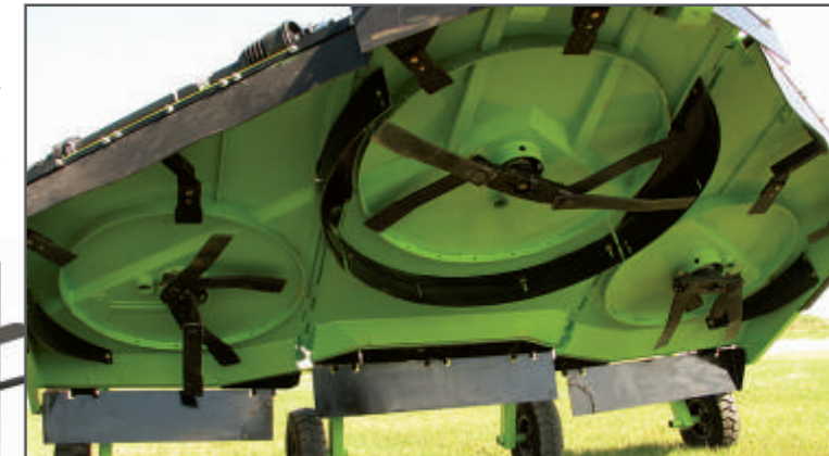
FX-315 Schulte systém