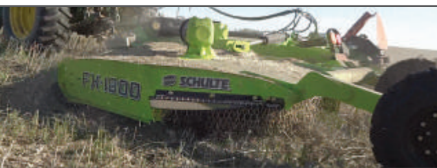
Rozdílný smysl otáčení nožů přispívá k lepšímu rozptýlení materiálu