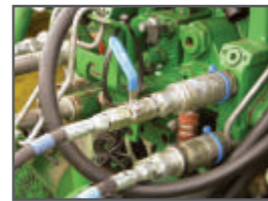
Hydraulický zámek pro křídla