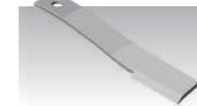
Extra odolné nože Schulte