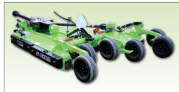
Specifikace XH – 1000

Snadnou údržbu, jednoduchý systém odpružení a vysokou provozní spolehlivost oceňují uživatelé dlouhodobě i v těch nejnáročnějších podmínkách.