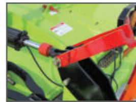
Jedno středové zajištění