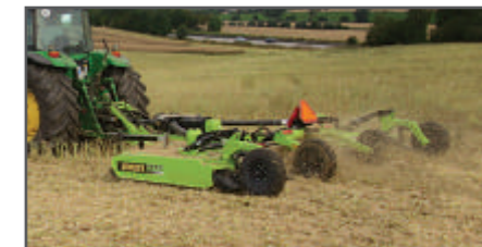
Při drcení strniště