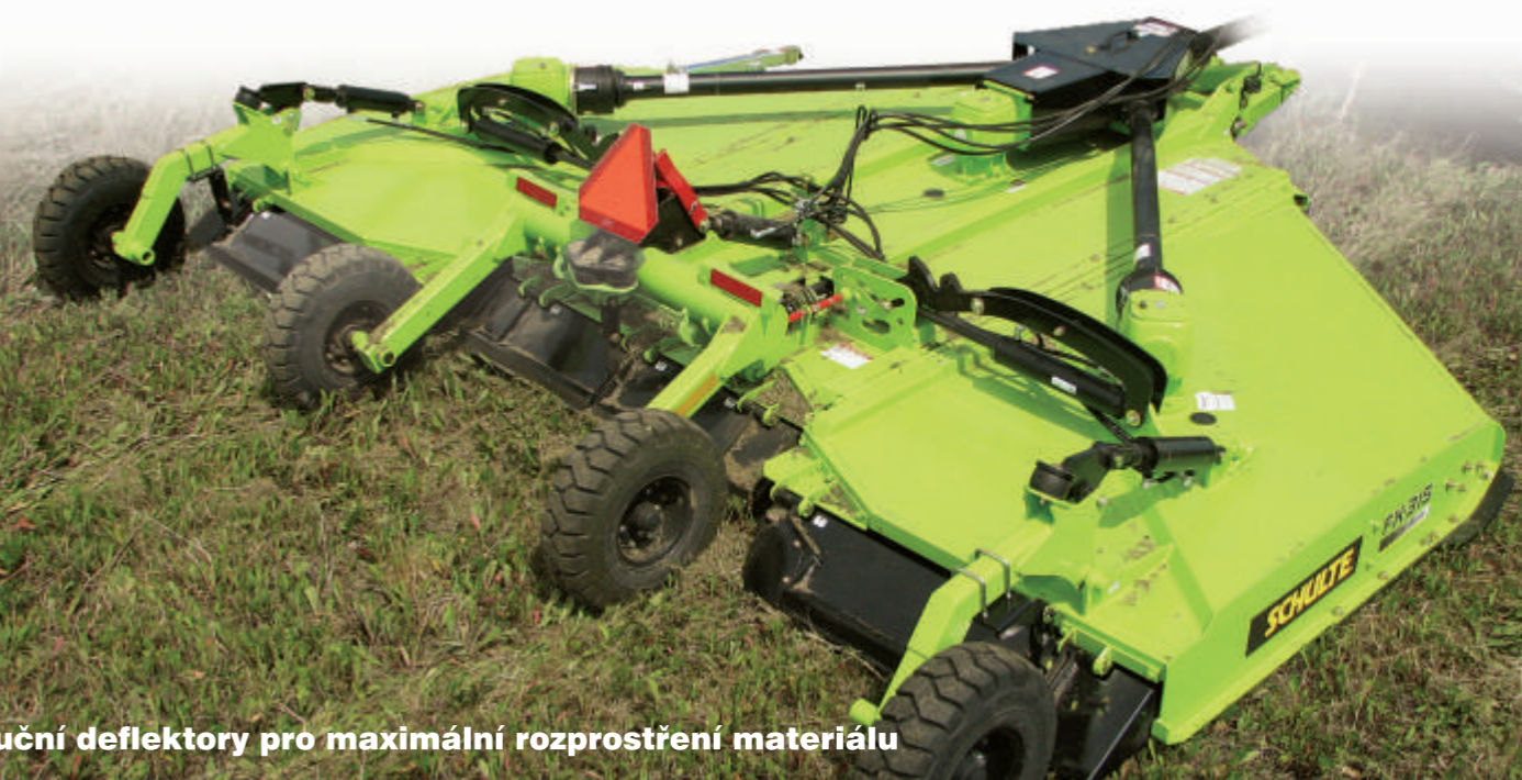
Distribuční deflektory pro maximální rozprostření materiálu