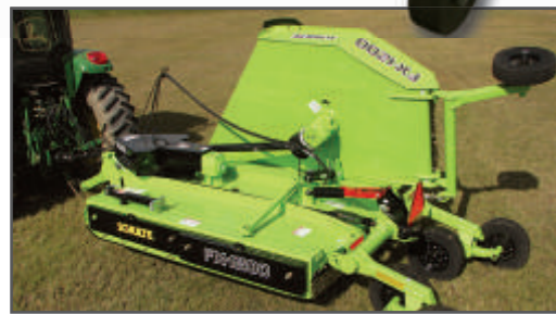
Specifikace FX -1200