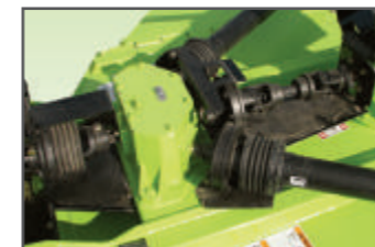
Jištění lamelovými spojkami