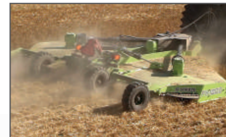
FX - 1800 zdvojené nože s protiostrím na strništi