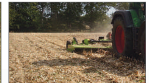
FX - 315 zdvojené nože s protiostrím při mulčování kukuřičného strniště